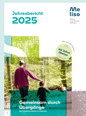
Erscheinungsbild von damals und heute.