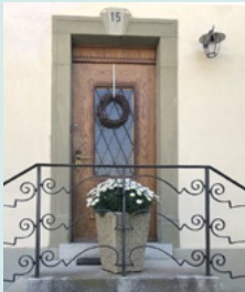
Allererste Hauseingangstüre am ersten Standort der HPLG an der Wernerstrasse 15 in Bern

Zitat von Paul Hofmann, Reportage Neue Zürcher Zeitung (Zeitbilder), 27./28. April 2002